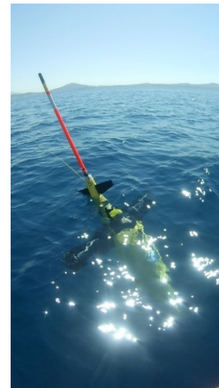
Seaglider en mer