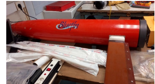
Maintenance du Spray