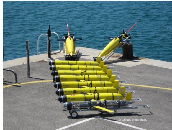
Le Parc à ses débuts