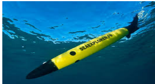
Plongée du SeaExplorer